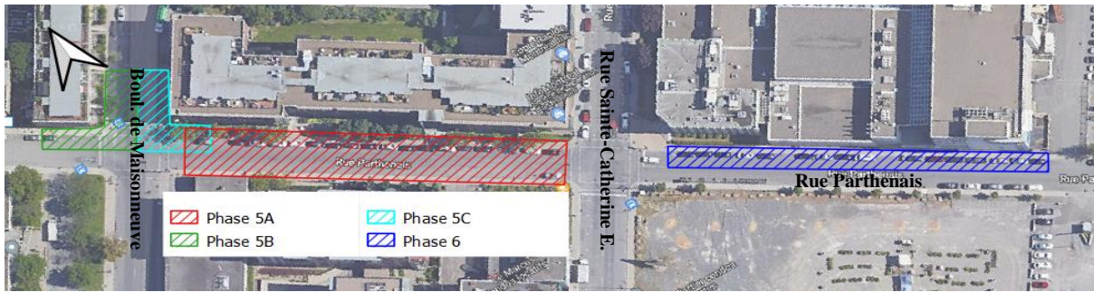
Phases 5 et 6

Date et durée des travaux : du 6 février 2023 à la fin août 2023