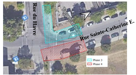
Phases 3 et 4